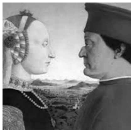
Piero della Francesca

"Egli è questo paese nostro dilettevole, ornato di belle vigne e di alberi fruttiferi e massimamente di aranci e di ulivi, che è cosa molto vaga da vedere. Sono tutti questi luoghi appresso il lato del mare pieni di fruttiferi alberi, et aranci e di limoni dai quali alberi se ne cavano diversi frutti... vi sono belle vigne che producono buoni vini. Ella è dotata dalla Natura delle cose necessarie per il vivere dei mortali".