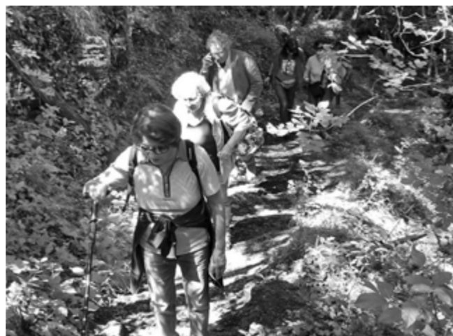
In cammino verso l'Eremo di S. Marco - Giugno 2018

L'Uteap ha sottoscritto una convenzione con Whirlpool Italia, sede di Comunanza in Via Villa Pera, con cui si offre a tutti gli iscritti la possibilità di acquistare prodotti in convenzione presso il suddetto punto vendita. In particolare l'accordo prevede che: