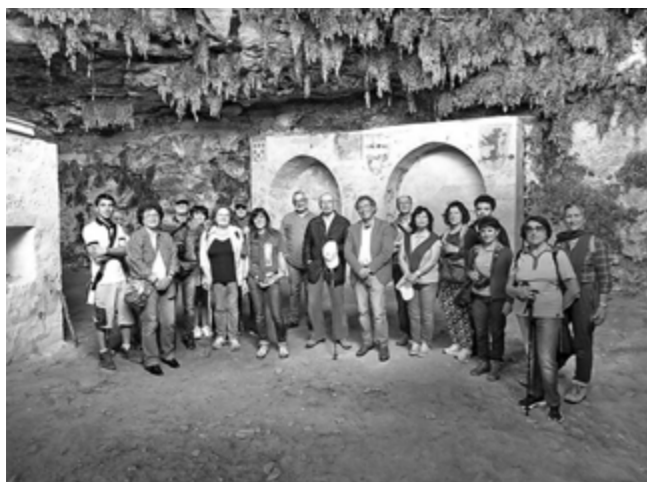
Foto di gruppo all'Eremo di S. Marco - Giugno 2018