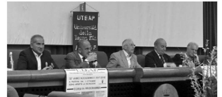
Il Tavolo delle Autorità