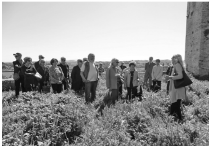
Nell'orto abbaziale a Campofilone