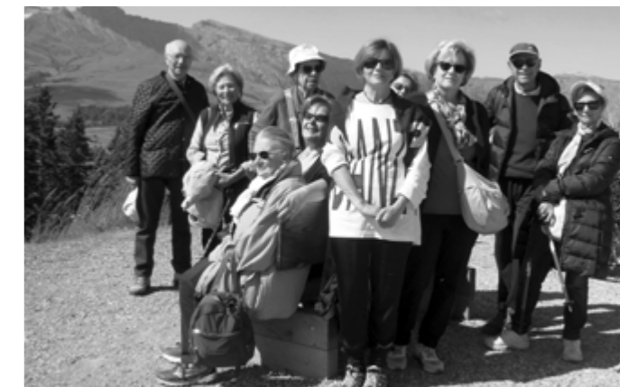
Un ricordo molto piacevole