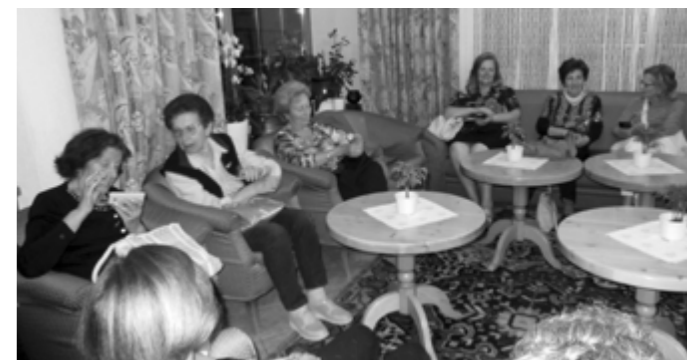
Il piacevole relax insieme