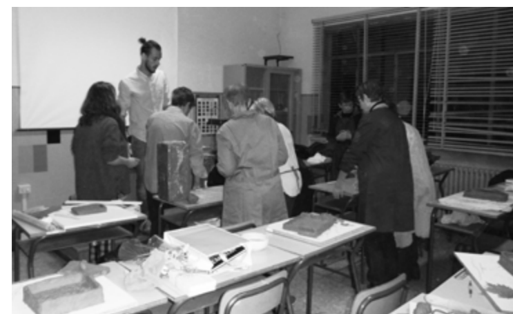
Lezione di Ceramica

Nelle conversazioni teoriche verranno affrontati temi pratici, come la produzione di manufatti in grandi dimensioni, forni elettrici ed artigianali, calchi con vari materiali siliconici per le riproduzioni agevolate del volto da modello vivente o da figura intera. Oltre questi argomenti le discussioni prevedono l'affinamento della cultura artistica legata alla ceramica, dall'arte antica a quella dei nostri contemporanei. Ci saranno anche brevi cenni riguardanti il mercato ed il sistema dell'arte, fatto di galleristi e curatori, ma soprattutto andremo a capire come mai queste opere raggiungono prezzi così alti.