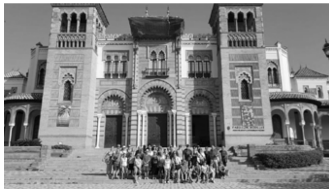
L'Uteap Pagliare a Siviglia al Parco Maria Luisa