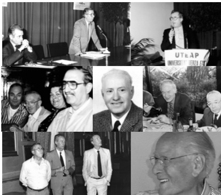
Soci fondatori dell'Uteap

sono diverse ad articolate le forme di associazione e numerosi i momenti ludico-culturali organizzati in sede e fuori. È in fase di potenziamento una già funzionante e ricca biblioteca consultabile dai docenti, allievi e anche da esterni con qualificata consulenza e guida di un responsabile. Le visite guidate a città, musei, luoghi di interesse turistico e i momenti di aggregazione (quali "Vacanze insieme" nel periodo estivo) sono parte integrante di un programma annuale molto partecipato. Non vi è poi angolo, monumento e iniziativa nel territorio ascolano che sfugga al Gruppo dei "Curiosi" accompagnati e guidati sempre da esperti. Merita poi di essere segnalata la pubblicazione di una rivista divulgata fra i soci ed all'esterno alla quale collaborano docenti ed allievi delle diverse discipline. Nel contesto della realtà cittadina l'Università è elemento propulsivo di iniziative, anche in collaborazione con altri organismi e associazioni. La Prolusione Ufficiale al 33° Anno Accademico di sabato 20 ottobre prevede una riflessione culturale e un breve spettacolo offerto dall'Istituto Musicale "Gaspare Spontini" alla cittadinanza.