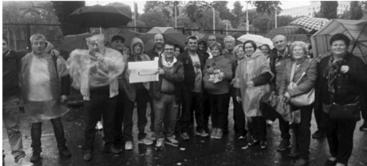
Sotto la pioggia ma felicemente

Invitati dalla Coldiretti di Ascoli Piceno, sabato 6 ottobre abbiamo partecipato all'evento "Villaggio della Coldiretti" al Circo Massimo a Roma. È stata una bellissima manifestazione, purtroppo il tempo non è stato clemente ma grazie ad una perfetta organizzazione che ci ha munito di poncho impermeabili abbiamo potuto godere pienamente della giornata. Tantissimi stand, alcuni dedicati alle aziende agricole di Marche ed Umbria colpite dal terremoto, presenti anche due aziende ascolane. Work-shop molto interessanti, sulla salvaguardia delle nostre produzioni agricole, su come seguire una sana alimentazione e sulla preparazione di piatti tipici regionali in cui erano ospiti personaggi importanti della cultura, dello sport e della politica. Un settore è stato dedicato all'esposizione di quelle razze animali tipiche della nostra Italia. Tanti anche i laboratori per i bambini. Ringraziamo la Coldiretti per la bellissima esperienza sicuramente da ripetere.