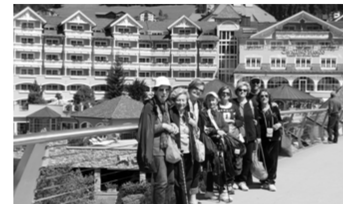
In posa in un posto incantevole