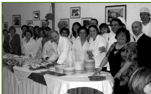
2° Corso di Gastronomia