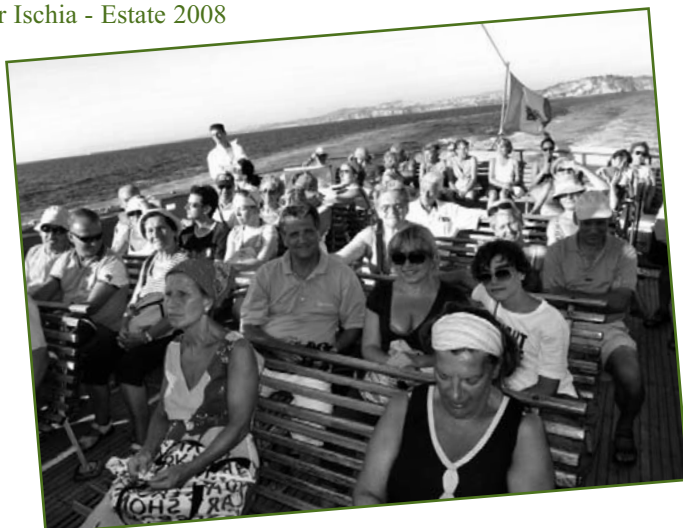
Ischia - Estate 2008: Sul traghettto