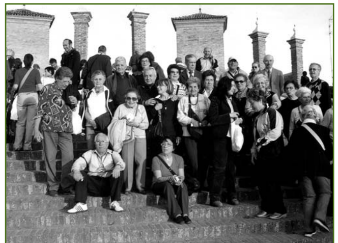
Una bella immagine della visita UTEAP a Comacchio - maggio 2008.