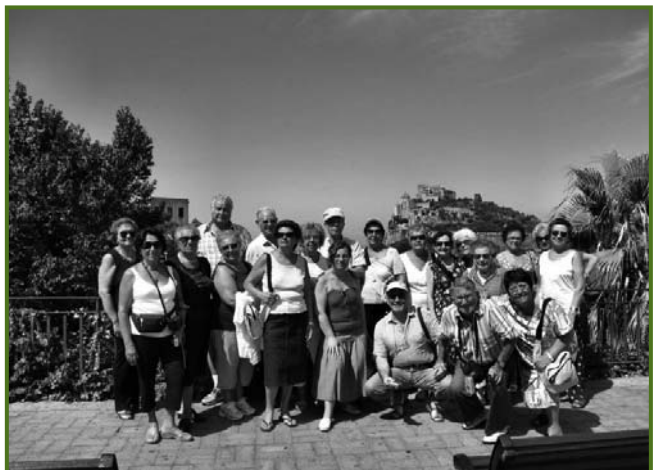
Ischia - Estate 2008