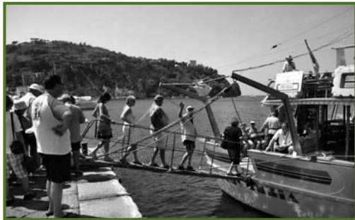
Ischia 2008 - Ci imbarchiamo

Le vacanze trascorse ad Ischia consentono ai visitatori attenti di mettersi sulle tracce di fonti miracolose, ricche di minerali, offrendo benessere, effetto snellente, drenante, purificante dei fanghi, con le maschere del viso, con l'applicazione su gambe, glutei ed addome con un risultato finale di dimagrimento e di tonificazione, di pelle morbida ed elastica. In sintesi acque termali e fanghi curativi per il viso e il corpo: due elementi, l'acqua e l'argilla, che da sempre costituiscono una formidabile fonte di benessere e di bellezza. Ecco che si spiega la corsa alle maschere dal potere depurativo e tonificante, meglio se con fanghi naturali che si trovano ad Ischia un po' ovunque: luoghi dove dalle viscere della terra e in maniera del tutto spontanea sgorgano quelle acque che hanno fatto dell'isola la capitale del termalismo e che di recente trovano una loro