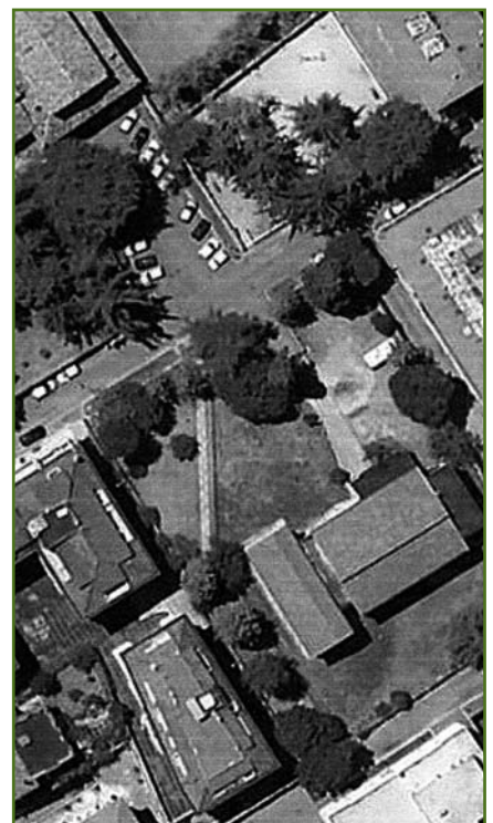
La Scuola di Porta Cappuccina, sede dell'UTEAP, in due immagini riprese dal satellite.

In conclusione si ritiene che anche quest'anno il Corso di Umanistica dell'UTEAP possa conseguire quel successo, soprattutto qualitativo, che peraltro non è mai mancato.