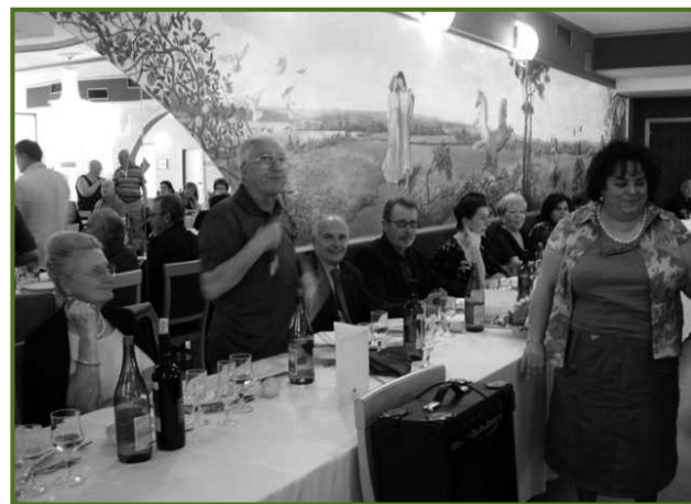
Festa di chiusura - Maggio 2008