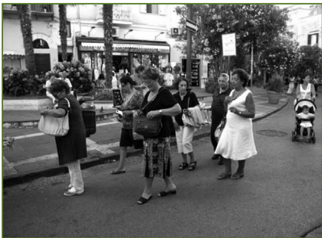
A spasso per Ischia - Estate 2008

menti ha determinato un lavoro capillare reso possibile solo dalla grande disponibilità di tutti, ed ha consentito negli ultimi anni il "salto di qualità" con il contestuale passaggio dalla trattazione di singoli moduli didattici all'analisi ragionata ed al commento, in diretta, dei più importanti fatti economici desunti dalla stampa specializzata. Quest'anno, su proposta del presidente Crementi, il corso di Economia raddoppierà le opportunità formative confermando, per gli iscritti da più anni, la trattazione analitica dei principali accadimenti economici; contemporaneamente verrà attivato un nuovo corso per le matricole interessate ad acquisire la conoscenza di base interagendo con una disciplina erroneamente considerata "difficile".