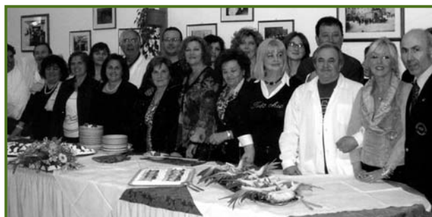
1° Corso di Gastronomia

Imparare a respirare, rilassarsi, concentrarsi, meditare, svelare se stessi e la Vita. Tramite insegnamenti, letture e molta pratica, aprire la grotta del Cuore e superare le nostre piccole menti immergendoci in quella "Vita più abbondante" che è la nostra reale natura. Ecco che si svelano Amore, Bellezza, Giustizia... ed anche il dolore non può più offuscare la splendente Gioia interiore; ...praticare per credere!