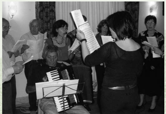
UTEAP Pagliare, Il coro