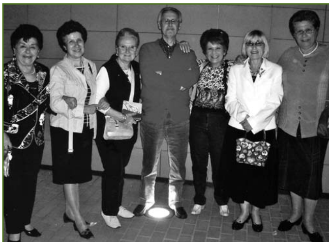
Rapporto uomini-donne iscritti all'UTEAP? Non è proprio così, ma le donne in effetti sono molte di più.