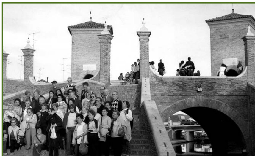
Comacchio - Maggio 2008