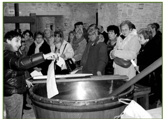
Visita alla Cartiera Papale - gennaio 2008