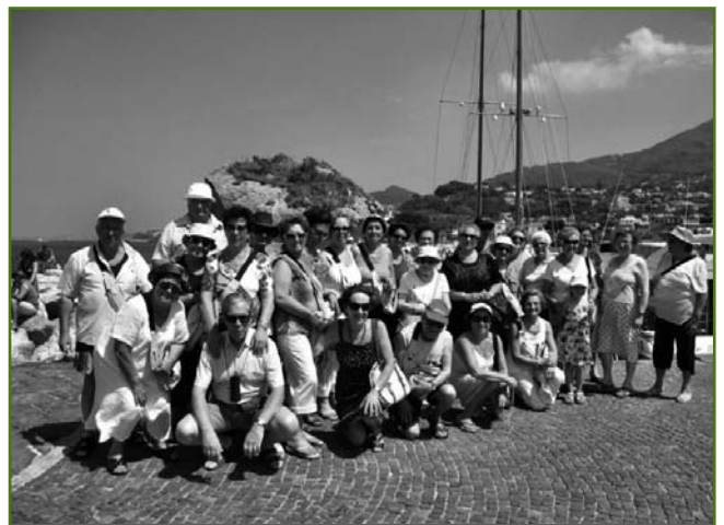
Foto di gruppo a Ischia - Estate 2008