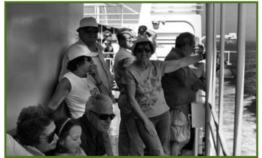
Ischia 2008 - Sul traghetto

i 70 ed i 100 gradi; esiste una tradizione dei bagnanti di cuocere sotto la sabbia della